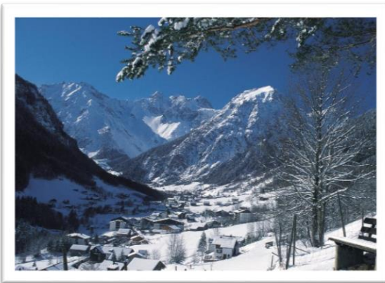
Mottakopf im Winter