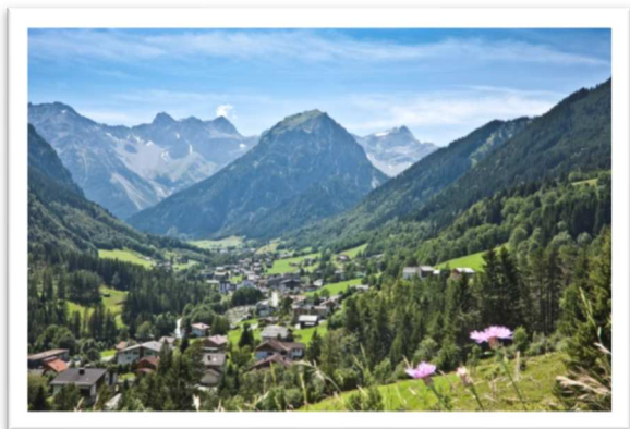
Mottakopf im Sommer